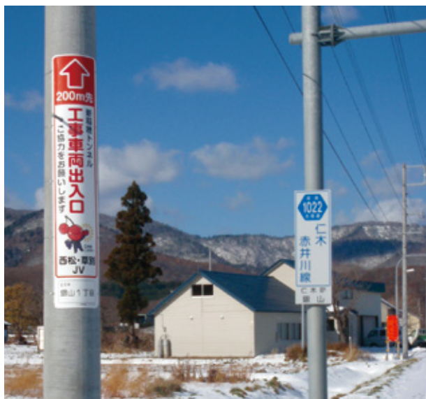
新稲穂トンネル R側仁木工区工事