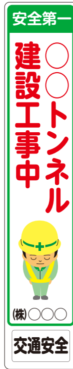
地域住民への注意喚起