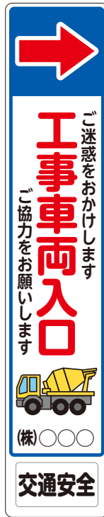
工事現場への誘導案内