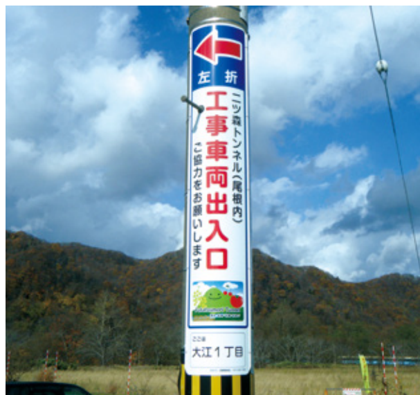
北海道新幹線 ニツ森トンネル工事