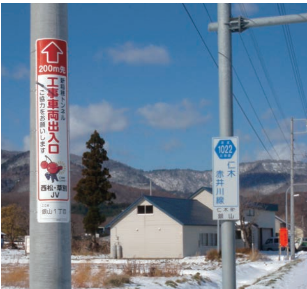
新稲穂トンネル R側仁木工区工事