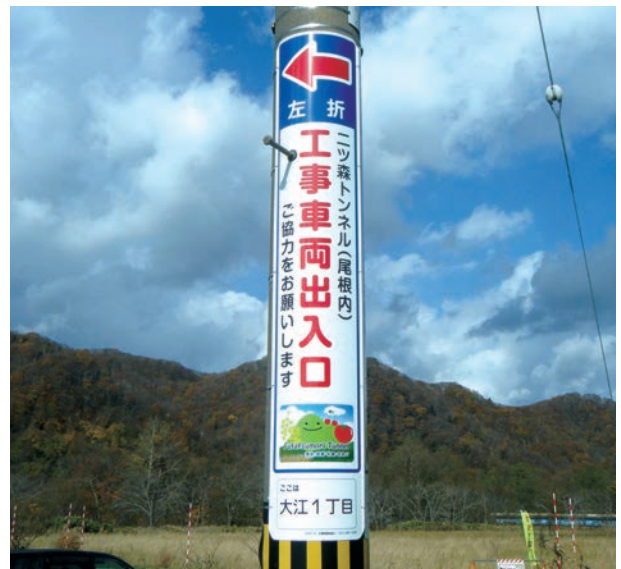
北海道新幹線 ニツ森トンネル工事